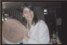
Atividade para Senhoras 06/04/2006