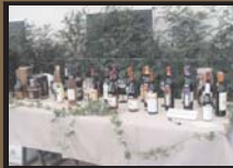
Bazar de Pessach 02/04/2006