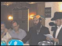
Festa infantil de Purim 13/03/2006