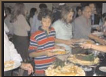
Banquete de Purim 14/03/2006