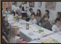
Seder de Pessach no Ejs 10/04/2006