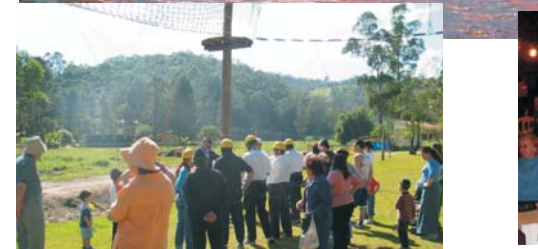
Shabbaton Comunitário na Região