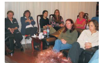
Grupo Feminino 23/05